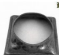
Переходник на трубу, арт. 8.606042 кв.60x60мм, переход на д=42x2мм Вес: 0.04 кг Цена: 45,90 руб.