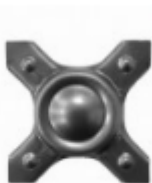
Декоративный колпачок, арт. 1911.36 65x65мм, д=35мм, под трубу 10x10мм Вес: 0.02 кг Цена: 21,50 руб.