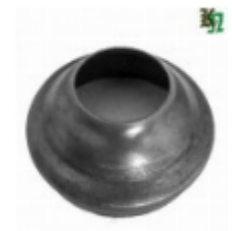
Переходник на трубу, арт. 8.8942