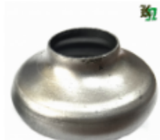
Переходник на трубу, арт. 8.2648 д=48мм, переход на д=26мм Вес: 0.08 кг Цена (за шт): 105 руб.