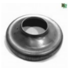
Переходник на трубу, арт. 8.15976