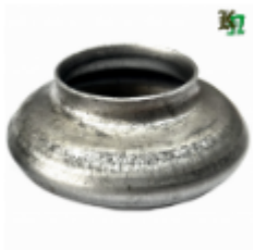
Переходник на трубу, арт. 8.3242