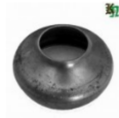
Переходник на трубу, арт. 8.7642