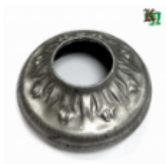
Переходник на трубу, арт. 8.5732