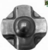
Декоративный колпачок, арт. 8.923 д=57x1,5мм Вес: 0.03 кг Цена: 18 руб.