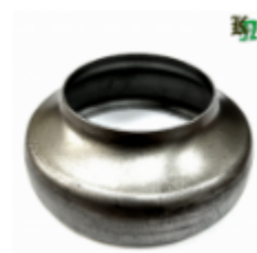
Переходник на трубу, арт. 8.10876