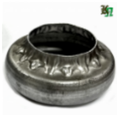
Переходник на трубу, арт. 8.878