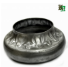
Переходник на трубу, арт. 8.877