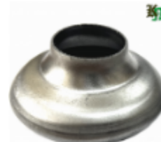
Переходник на трубу, арт. 8.2642 д=42мм, переход на д=26мм Вес: 0.08 кг Цена (за шт): 105 руб.