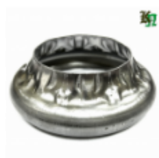
Переходник на трубу, арт. 8.883