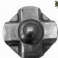
Декоративный колпачок, арт. 8.925 д=45x1,2мм Вес: 0.02 кг Цена: 17 руб.