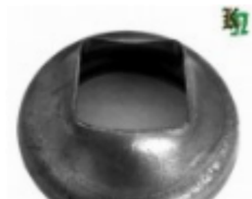
Переходник на трубу, арт. 8.764040 д=76мм, переход на кв.40x40 Вес: 0.23 кг Цена: 115 руб.