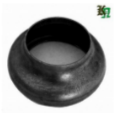
Переходник на трубу, арт. 8.5742