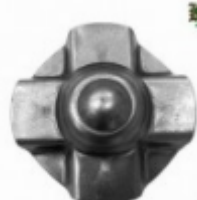
Декоративный колпачок, арт. 8.922 д=75x1,5мм Вес: 0.06 кг Цена: 25 руб.