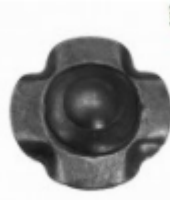
Декоративный колпачок, арт. 8.929 д=45x1,5мм Вес: 0.018 кг Цена: 23 руб.