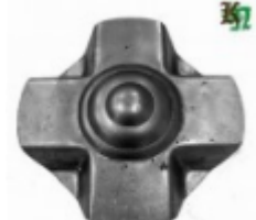
Декоративный колпачок, арт. 8.920 д=120x1,5мм Вес: 0.14 кг Цена: 66 руб.