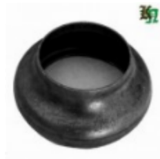
Переходник на трубу, арт. 8.7657