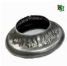
Переходник на трубу, арт. 8.876