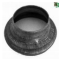
Переходник на трубу, арт. 8.8957