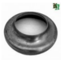
Переходник на трубу, арт. 8.159102