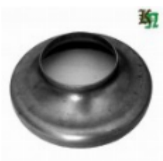
Переходник на трубу, арт. 8.15989