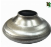
Переходник на трубу, арт. 8.2242 д=42мм, переход на д=22мм Вес: 0.08 кг Цена (за шт): 105 руб.