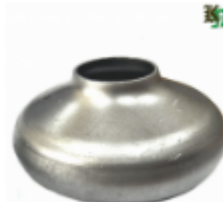
Переходник на трубу, арт. 8.2248 д=48мм, переход на д=22мм Вес: 0.08 кг Цена (за шт): 105 руб.