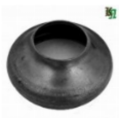
Переходник на трубу, арт. 8.10257