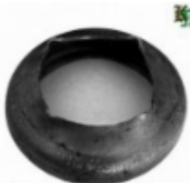
Переходник на трубу, арт. 8.1026060 д=102мм, переход на кв.60x60мм Вес: 0.31 кг Цена: 150 руб.