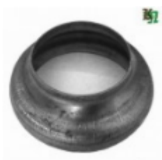
Переходник на трубу, арт. 8.10276