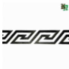
Декоративный прокат, полоса, арт. 820 1200х95х2.5мм Вес: 1.2 кг Цена (за штуку): 480 руб.