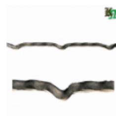
Квадрат для решетки, обжатый, арт. 179 1900мм, кв.10х10мм Вес: 1.5 кг Цена (за штуку): 350 руб.