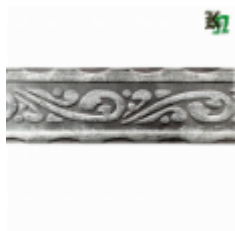
Полоса, арт. 40407П 3000x40x4мм Вес: 4.3 кг Цена (за штуку): 475 руб.