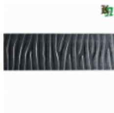
Полоса, арт. 40411П 3000x40x4мм Вес: 4.3 кг Цена (за штуку): 475 руб.