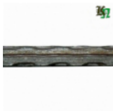
Квадрат, арт. 10Д2 3000мм, кв.10x10мм Вес: 2.38 кг Цена (за штуку): 320 руб.