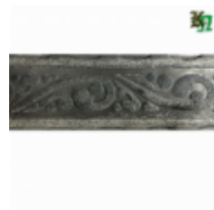
Полоса, арт. 50507П 3000x50x5мм Вес: 5 кг Цена (за штуку): 600 руб.