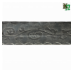
Полоса, арт. 40404П 3000x40x4мм Вес: 4.3 кг Цена (за штуку): 475 руб.