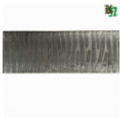
Полоса, арт. 50511П 3000x50x5мм Вес: 5 кг Цена (за штуку): 600 руб.