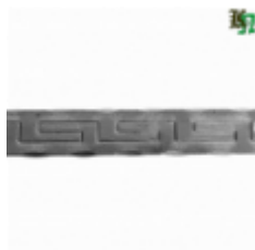
Полоса, арт. 40408 3000x40x4мм Вес: 4.3 кг Цена (за штуку): 400 руб.