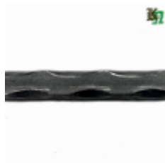
Квадрат, арт. 12Д5 3000мм, кв.12x12мм Вес: 3.43 кг Цена (за штуку): 540 руб.