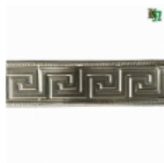
Декоративный прокат, полоса, арт. 412.26 2500х80х1мм Вес: 1.37 кг Цена (за штуку): 650 руб.