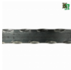
Полоса, арт. 20402П 2930x20x4 Вес: 2.2 кг Цена (за штуку): 320 руб.