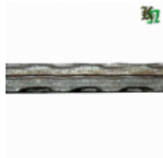
Квадрат, арт. 14Д2 3000мм, кв.14х14мм Вес: 4.4 кг Цена (за штуку): 660 руб.