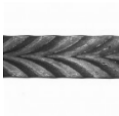
Полоса, арт. 32501П 3000x32x4мм Вес: 3.35 кг Цена (за штуку): 1 250 руб.