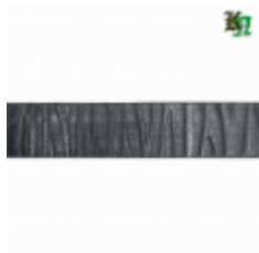
Полоса, арт. 20403П 3000x20x4мм Вес: 2.17 кг Цена (за штуку): 350 руб.