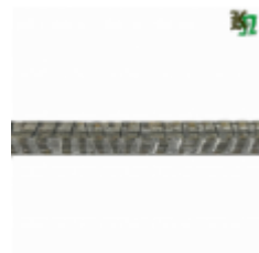
Квадрат, арт. 12Д3 3000мм, кв.12x12мм Вес: 3.43 кг Цена (за штуку): 480 руб.