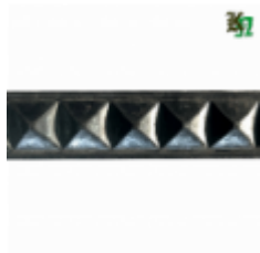
Полоса, арт. 32901П 3000x32x9мм Вес: 3.35 кг Цена (за штуку): 1 600 руб.