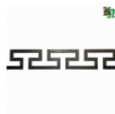
Декоративный прокат, полоса, арт. 824 1200х95х2,5мм Вес: 1.2 кг Цена (за штуку): 490 руб.