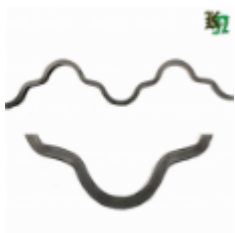
Монастырская вязь, арт. 180 1650мм, кв.12х12мм Вес: 2.26 кг Цена (за штуку): 450 руб.