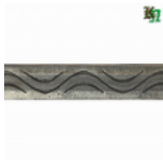
Полоса, арт. 20401П 3000x20x4мм Вес: 2.17 кг Цена (за штуку): 350 руб.