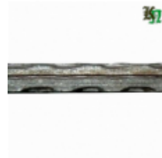
Квадрат, арт. 16Д2 3000мм, кв.16х16мм Вес: 5.85 кг Цена (за штуку): 1 000 руб.