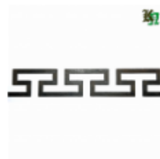
Декоративный прокат, полоса, арт. 823 1200х80х2,5мм Вес: 1.2 кг Цена (за штуку): 460 руб.