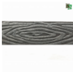
Полоса, арт. 40409П 3000x40x4мм Вес: 4.3 кг Цена (за штуку): 490 руб.