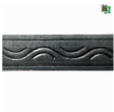
Полоса, арт. 40406П 3000x40x4мм Вес: 4.3 кг Цена (за штуку): 475 руб.