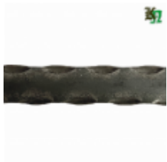
Полоса, арт. 25401П 3000x25x4 Вес: 2.4 кг Цена (за штуку): 350 руб.