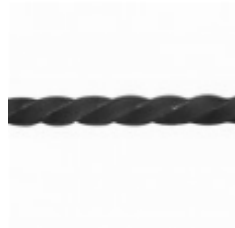
Квадрат, арт. 14Д4 3000мм, кв.14х14мм Вес: 4.4 кг Цена (за штуку): 600 руб.