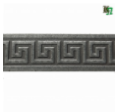
Полоса, арт. 40412П 3000x40x4мм Вес: 4.3 кг Цена (за штуку): 490 руб.