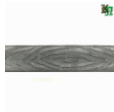
Полоса, арт. 25409П 3000x25x4 Вес: 2.4 кг Цена (за штуку): 350 руб.