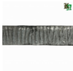
Полоса, арт. 30411П 3000x30x4мм Вес: 2.8 кг Цена (за штуку): 400 руб.