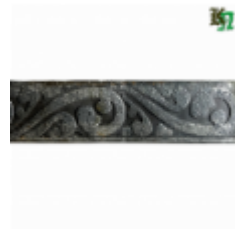
Полоса, арт. 30407П 3000x30x4мм Вес: 2.8 кг Цена (за штуку): 400 руб.