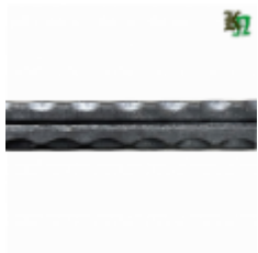
Полоса, арт. 12602П 3000x12x6мм Вес: 1.7 кг Цена (за штуку): 270 руб.